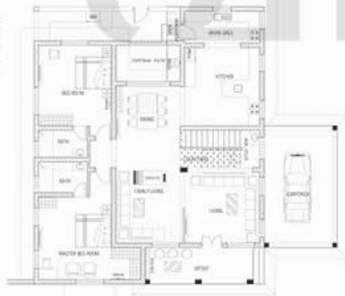
താഴത്തെ നിലയുടെ പ്ലാൻ

ഡൈനമിങ്ങിനോടു ചേർന്ന് കോർട്ടയാർഡ് ഒരുക്കി.