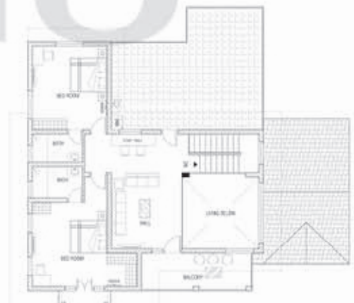
മുകളിലേക്കുള്ള നിലയുടെ പ്ലാൻ